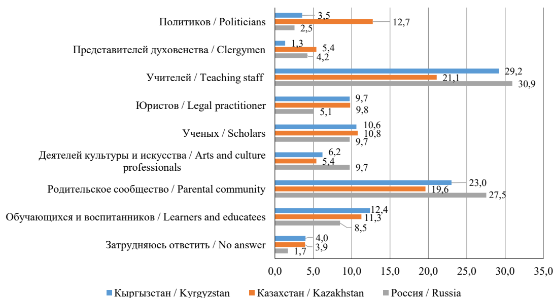
Р и с. 3. Распределение ответов на вопрос: «Кого, по Вашему мнению, в первую очередь необходимо привлечь к публичному обсуждению и принятию норм, регламентирующих воспитательную деятельность?»