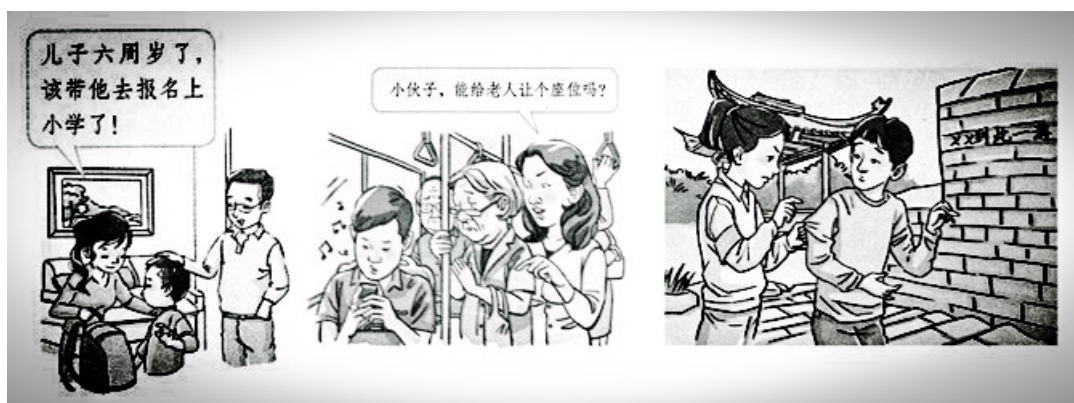
Р и с. 3. Иллюстрация законов «Об обязательном образовании», «О защите прав и интересов престарелых», «О туризме»

Об эффективности реформы учебников и соблюдении конфуцианского принципа чжун («忠») – «служить верой и правдой» правительству и идеям нравственности, говорит и мнение 56,86 % опрошенных нами людей, которые отметили, что увеличение количества тем, разъясняющих законодательные и нормативные акты, толкование правовых норм (закона) и другие конституционные знания, повлияло на рост гражданской и коллективной ответственности; 34,31 % указали на повышение правовой грамотности.