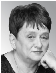
М. Б. Лига