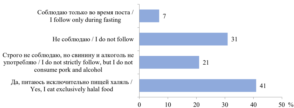
Р и с. 2. Распределение ответов на вопрос о соблюдении ограничений в питании, накладываемых исламом, %