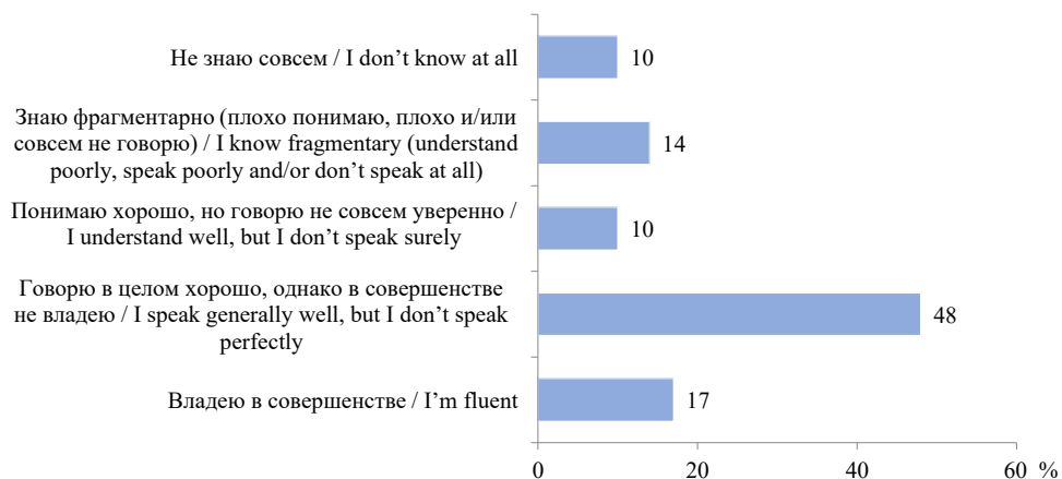
Р и с. 1. Распределение ответов на вопрос о владении татарским языком среди респондентов, % 9