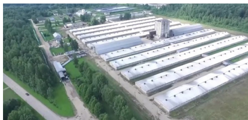
Р и с. 2. Внешний вид свиноводческого комплекса F i g. 2. View of the pig breeding complex

Содержание животных – бесподстилочное на частично щелевых полах. Навоз самотеком поступает в навозоприемник, расположенный на свиноводческом комплексе. Площадки для переработки свиного навоза в органическое удобрение представлены на рисунке 3.