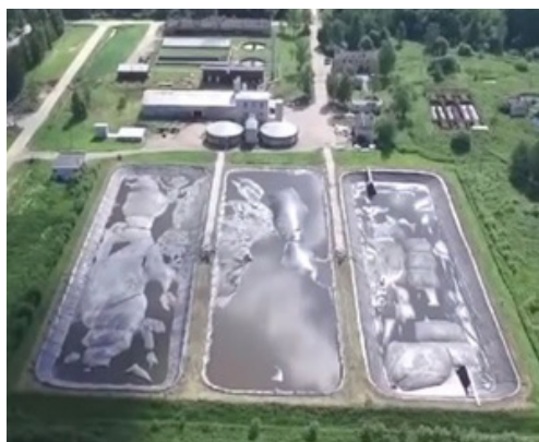
Р и с. 3. Площадка для переработки свиного навоза в органическое удобрение – герметичные лагуны с мембранным покрытием для обедненной фракции после ректификации F i g. 3. Facilities for processing pig manure into organic fertilizers – water-tight lagoons with membrane cover for the depleted liquid fraction after rectification

Количественные и качественные характеристики свиного навоза, его твердой и жидкой фракции, а также конечных продуктов представлены в таблице 1.