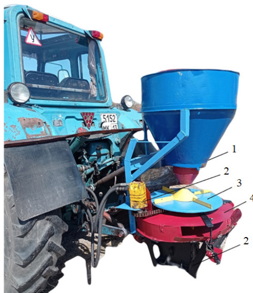
Р и с. 2. Экспериментальная лабораторно-полевая установка:

Конструктивное решение исполнительного элемента, используемого в данной установке, подтверждено патентом РФ на полезную модель [24; 25].