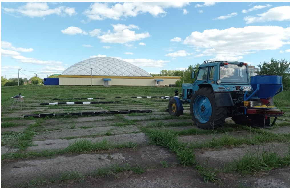
Р и с. 3. Фрагмент экспериментальных исследований

За неравномерность распределения удобрений на общей и рабочей ширине внесения принимали коэффициент вариации массы удобрений, попавшей в отдельные контейнеры размером 1,00 \times 0,25 \times 0,15 м, установленные на общую ширину в сплошной ряд перпендикулярно к направлению движения машинно-тракторного агрегата (рис. 3).