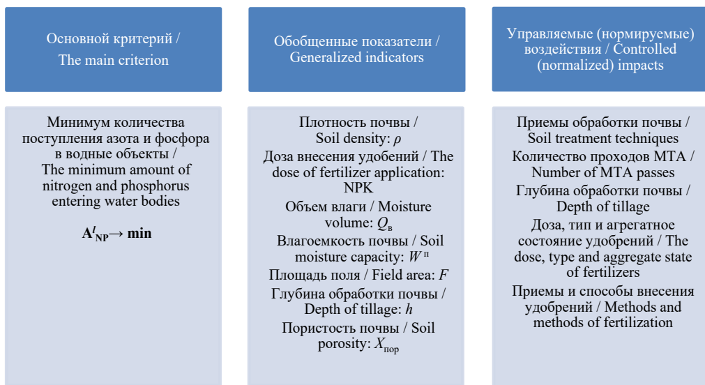
Р и с. 1. Схема взаимосвязи критерия минимума количества поступления биогенных элементов в водные объекты с другими зависящими от него показателями F i g. 1. Diagram of the relationship between the criterion for the minimum amount of nutrients entering water bodies and other indicators that depend on it

Количество биогенных элементов с 1 га сельскохозяйственных угодий, которое может поступить в водные объекты, можно рассчитать по формуле: