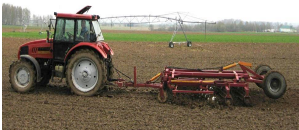
Р и с. 2. Трактор «Беларус-922» с комбинированным агрегатом АКШ-3,6-01

Для определения реальной скорости трактора был размечен зачетный